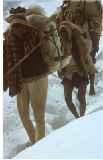
Passage du Mabu Pass. Première neige et plongée vers la vallée de la Tila.