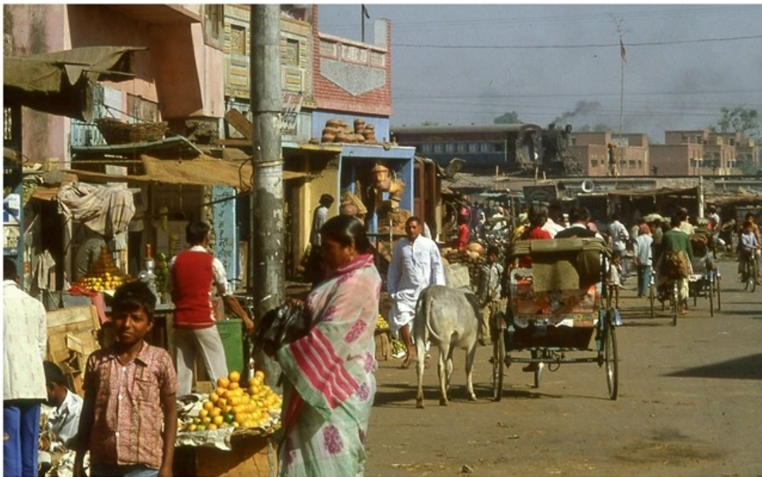
Passage par les Indes (Gorakhpur) et retour au Népal à Nepalganj, la route du Terai étant impraticable.