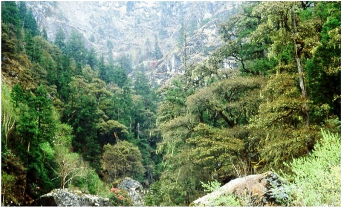
La forêt de bouleaux et de rhododendrons atteint presque 4'000 m.