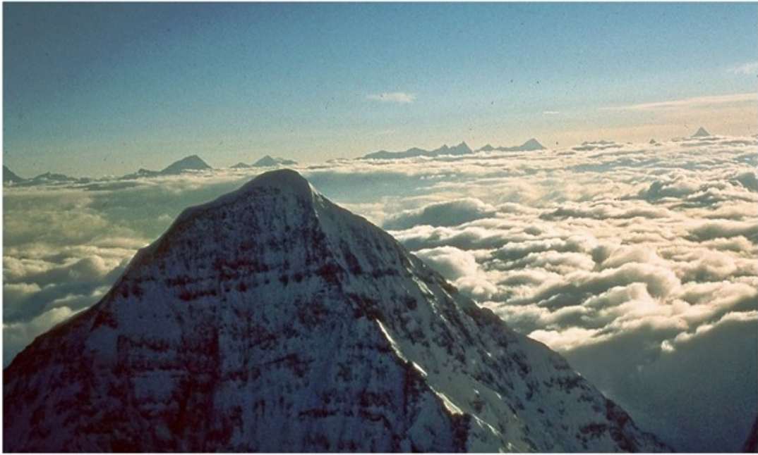
Vue imprenable au nord sur le Bhulu Lhasa et les montagnes du Tibet. Des cordes fixes sont installées le long de l'arête.