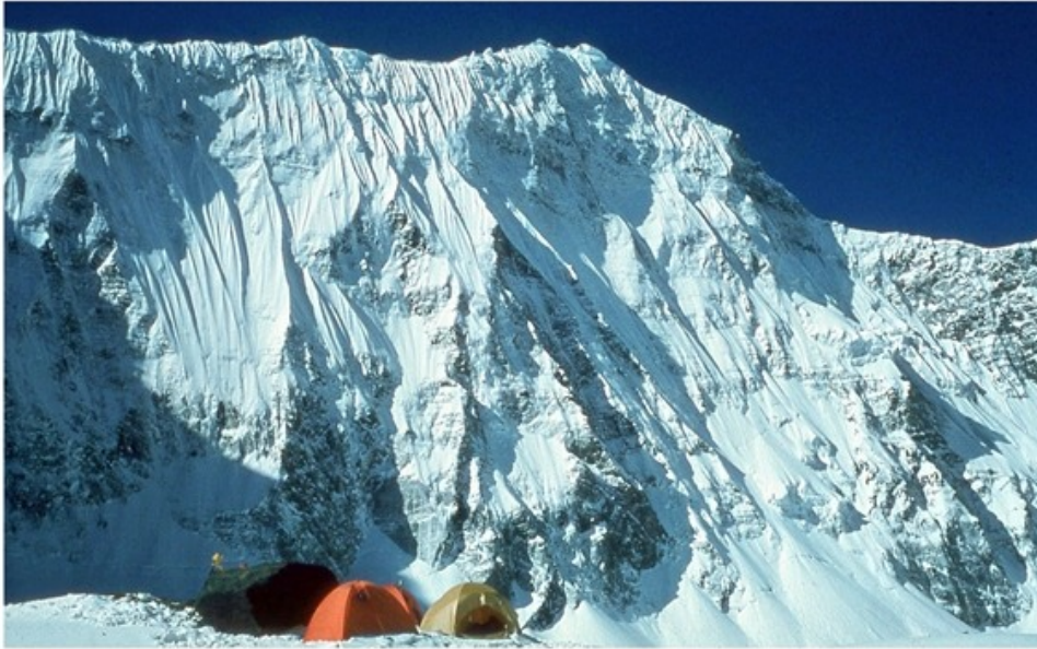
Le camp 3 est établi à 5'150 m, au pied de l'arête NW du Sisne, aujourd'hui appelé Patrali. Des avalanches dévalent la face du Kande Hiunchuli.