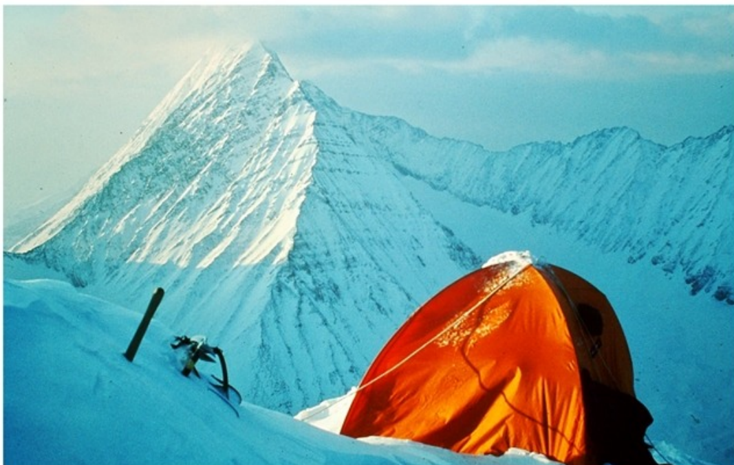
Un camp 5 provisoire est posé en équilibre sur le fil de l'arête, vers 6'000 m.