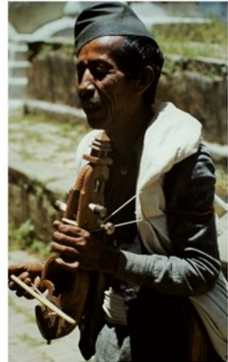
Kathmandu Premier contact avec le Népal et sa capitale pour la plupart d'entre nous.