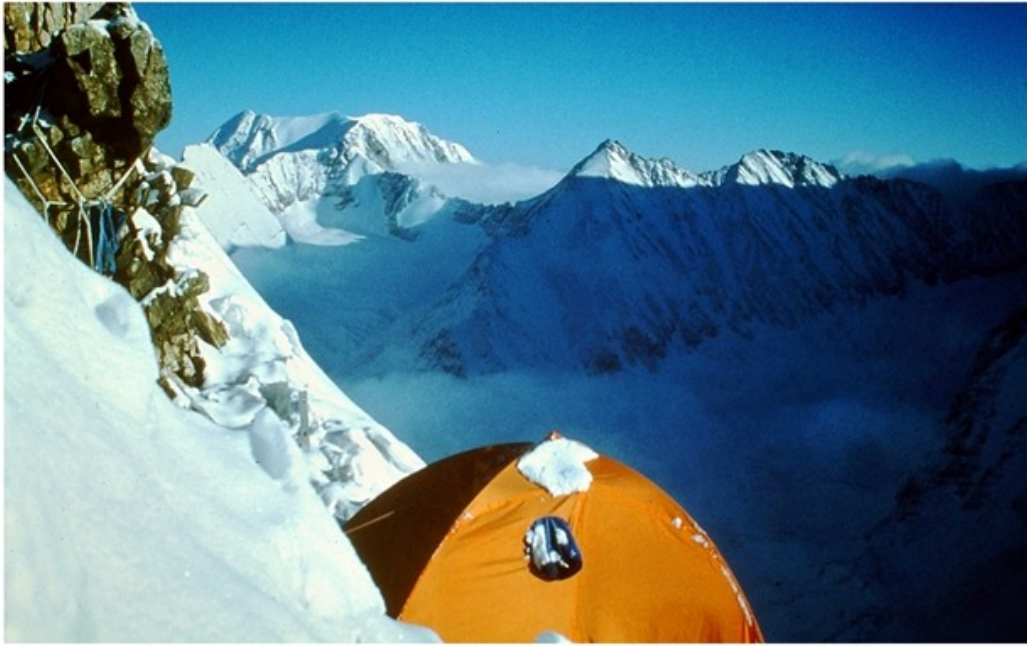
Le camp 4 est posé sur l'arête, à 5'660 m.