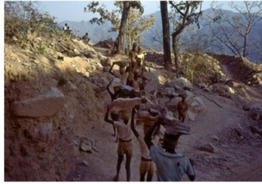
La route Nepalganj - Surkhet est en pleine construction.